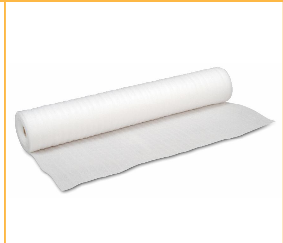
Lámina de polietileno de alta calidad, fabricada mediante proceso de extrusión directa y expansión física, de celdas cerradas y estancas que le aportan la consistencia adecuada. Este producto es óptimo para el aislamiento acústico a ruidos de impacto en suelos flotantes. Su reducido espesor y formato permiten un fácil manejo y sencilla instalación.