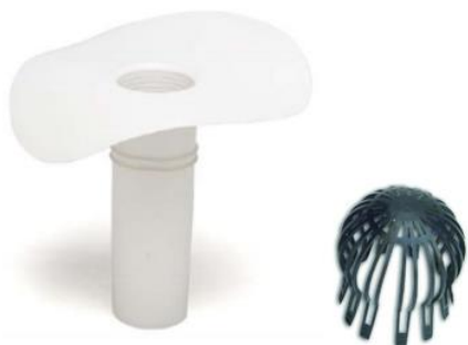
Fig.1: Cazoleta (izqda.) y paragravillas (dcha.)